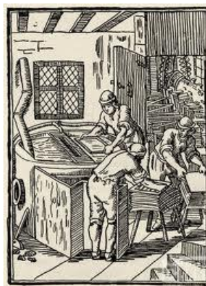
Hlazení papírové hmoty