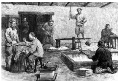
výroba papíru v Číně

Dnešní papír je tedy známý přibližně dva tisíce let a po většinu této doby byl vyráběn ručně.